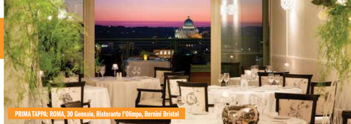
PRIMA TAPPA: ROMA, 30 Gennaio, Ristorante l'Olimpo, Bernini Bristol

TUTTI GLI AGGIORNAMENTI SUL PROSSIMO NUMERO