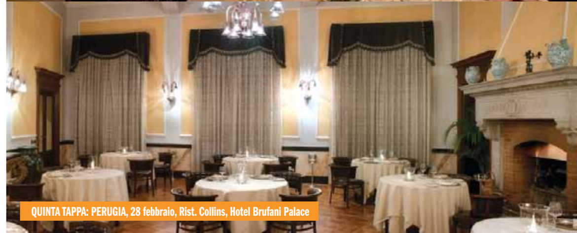
QUINTA TAPPA: PERUGIA, 28 febbraio, Rist. Collins, Hotel Brufani Palace