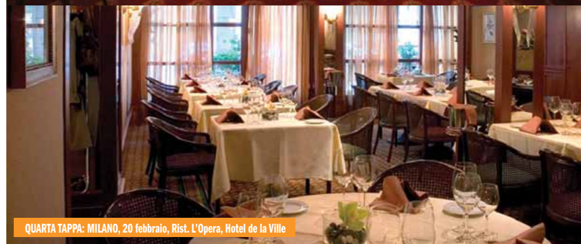
QUARTA TAPPA: MILANO, 20 febbraio, Rist. L'Opera, Hotel de la Ville