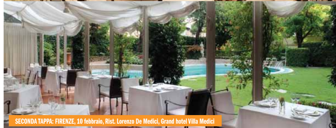
SECONDA TAPPA: FIRENZE, 10 febbraio, Rist. Lorenzo De Medici, Grand hotel Villa Medici