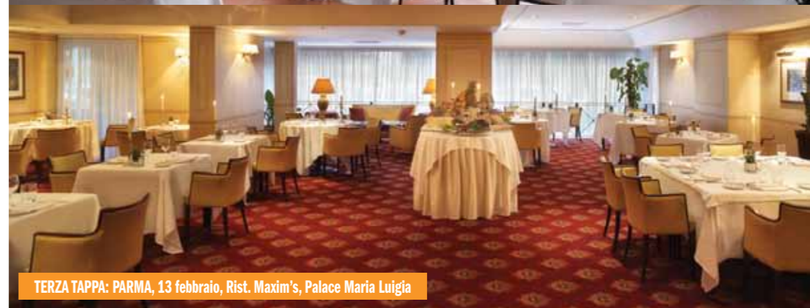
TERZA TAPPA: PARMA, 13 febbraio, Rist. Maxim's, Palace Maria Luigia