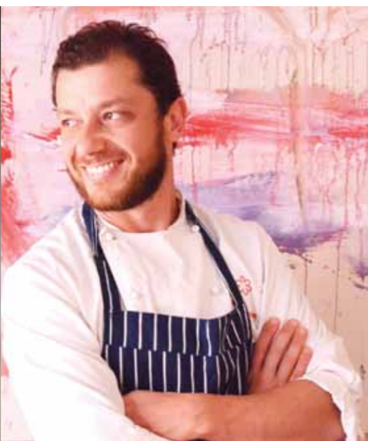
QUINTA TAPPA: 28 febbraio, PERUGIA, Rist. Collins, Hotel Brufani Palace Dedicata al film "Forrest Gump"